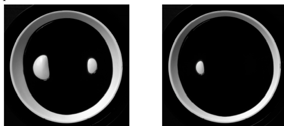
Illustration 7: un sommet disparaît

Finalement, chaque fois que l'eau passe au-dessus d'un sommet (à l'origine une dépression), une ligne côtière disparaît – voir l'illustration 7.