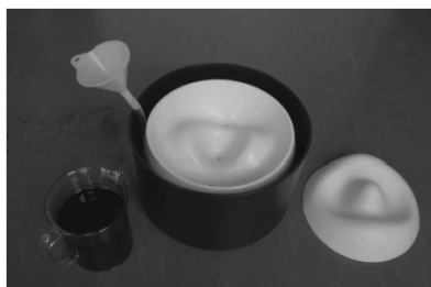
Illustration 2: une île, à l'endroit et retournée.

La preuve repose sur l'idée suivante. Imaginez-vous l'île sous forme de modèle, avec un petit trou dans chaque sommet. Retournez ensuite l'île, de manière à visualiser un bassin, comme le montre l'illustration 2. Nous pouvons sans autre supposer que toutes les dépressions, tous les cols et tous les sommets présentent différentes hauteurs.