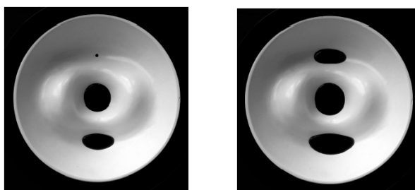
Illustration 4: un nouveau lac se forme (en haut)

Observons tout d'abord le nombre de lacs. Au début, il n'y a pas de lac. Chaque fois que le niveau de l'eau dépasse une nouvelle dépression (laquelle était originellement un sommet), un nouveau lac se crée – voir l'illustration 4. Ceci se produit en tout M_0 fois.