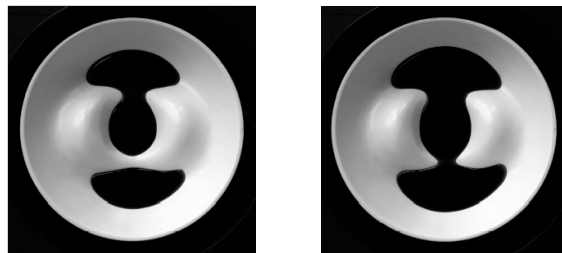
Illustration 5: deux lacs se rejoignent ou col de type M^-