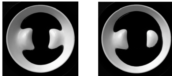
Illustration 6: un lac se rejoint lui-même ou col de type M^+

Qu'advient-il de la ligne côtière? Chaque fois que le niveau de l'eau remplit une dépression, un nouveau lac se forme et nous obtenons donc une ligne côtière supplémentaire – voir l'illustration 4.