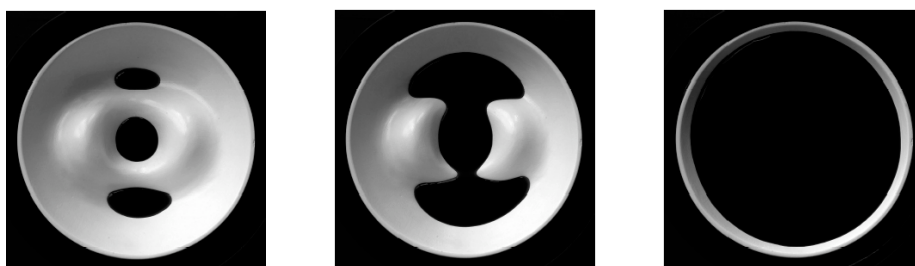
Illustration 3: le niveau de l'eau monte

Vous remarquez que les dépressions se sont transformées en sommets et inversement, alors que les cols restent des cols. Bien que M_0 et M_1 soient inversés, l'équation (1) reste valable. Si nous plongeons ensuite lentement notre modèle dans l'eau, de petits lacs se forment. Au fur et à mesure que l'eau monte, ceux-ci se retrouvent reliés. A la fin, il nous reste un seul lac et une seule ligne côtière, lesquels constituent désormais les seules données fondamentales – voir l'illustration 3.