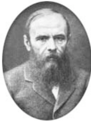
Fédor Mikhaïlovitch Dostoïevski (1821-1881)